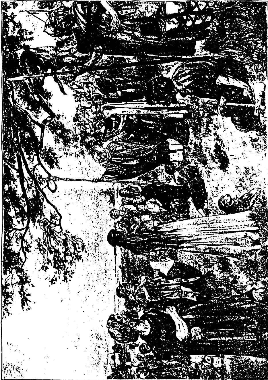
Ludger predikt in de Groninger Gouwen, 785.